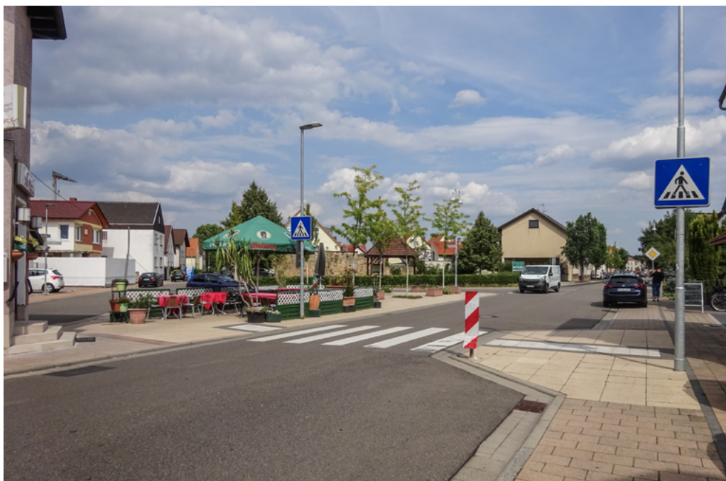
Abbildung 7: Gehwegnase verkürzt Querung für Fußgänger; St. Leon-Rot

Gehwegnasen („Gehwegvorstreckungen“) führen den Gehweg, der beispielsweise hinter einem Kfz-Parkstreifen liegt, an die Fahrbahn heran. Sie verkürzen den Querungsweg und verbessern die Sichtverhältnisse. Gehwege, die im Einmündungsbereich von Nebenstraßen durchgezogen werden („Gehwegüberfahrt“), verbessern ebenfalls die Sichtbeziehungen und reduzieren die Abbiegeschwindigkeit, da Autofahrende beim Abbiegen eine Schwelle überfahren müssen. Außerdem sind die Gehwege durch das durchgängige Hochbord barrierefrei.