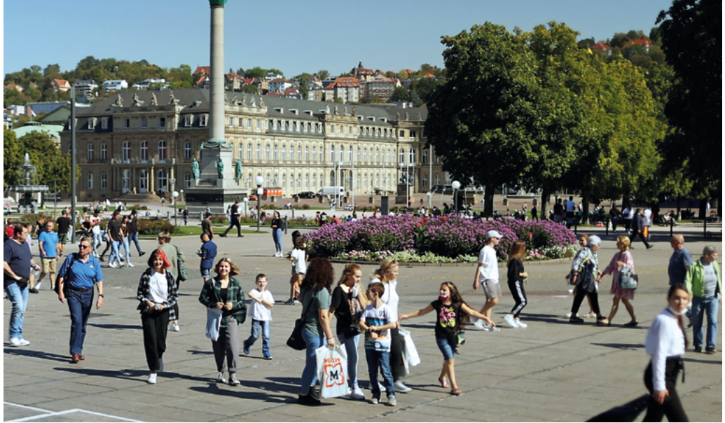
Abbildung 16: Schlossplatz Stuttgart