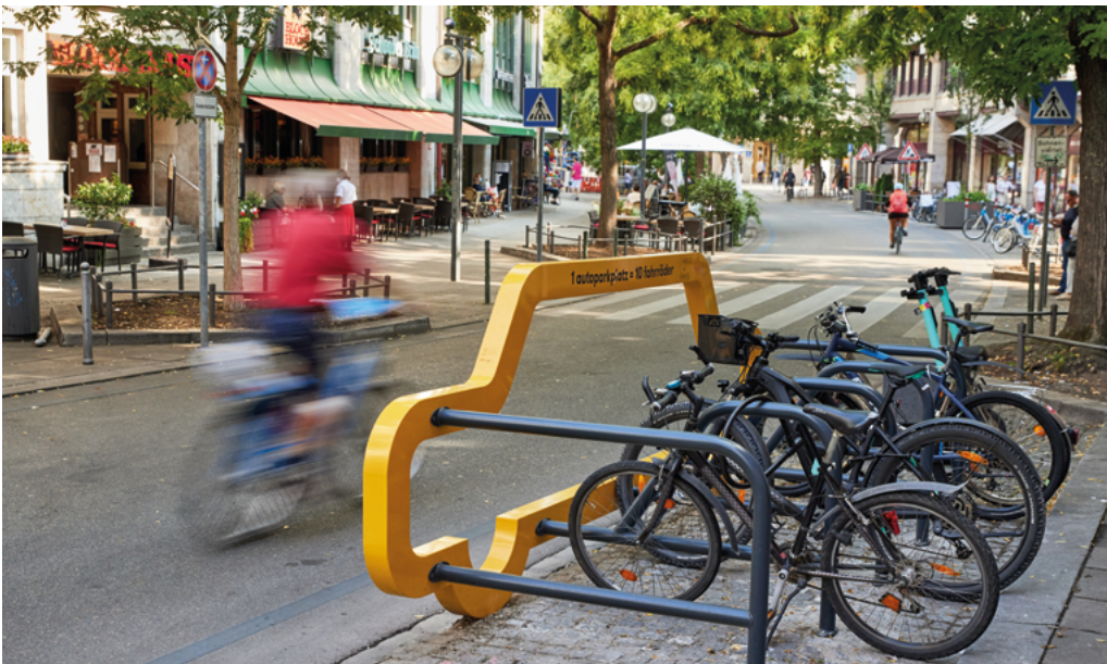
Abbildung 14: Fahradabstellplätze auf einem früheren Kfz-Stellplatz entlasten die Gehwege; Stuttgart

Auch „kleine“ Hindernisse können eine unüberwindbare Barriere darstellen. Ein häufiges Beispiel sind Treppenstufen – etwa bei Geschäfts- und Hauseingängen. Nachträglich angebrachte Rampen oder Handläufe erleichtern hier die eigenständige Mobilität zu Fuß. Auch Fahrradparken auf dem Gehweg kann zu Einschränkungen für Fußgängerinnen und Fußgänger führen. Wichtige Hinweise, wo Barrieren bestehen und wo es Verbesserungen braucht, können beispielsweise in einem Fußverkehrs-Check gesammelt werden.