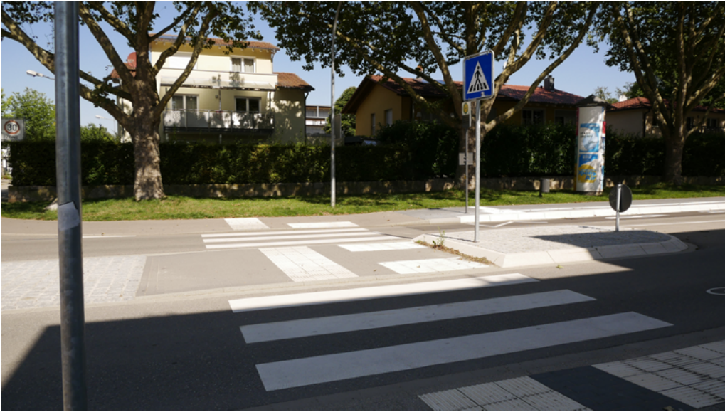
Abbildung 6: Querungshilfe in Offenburg