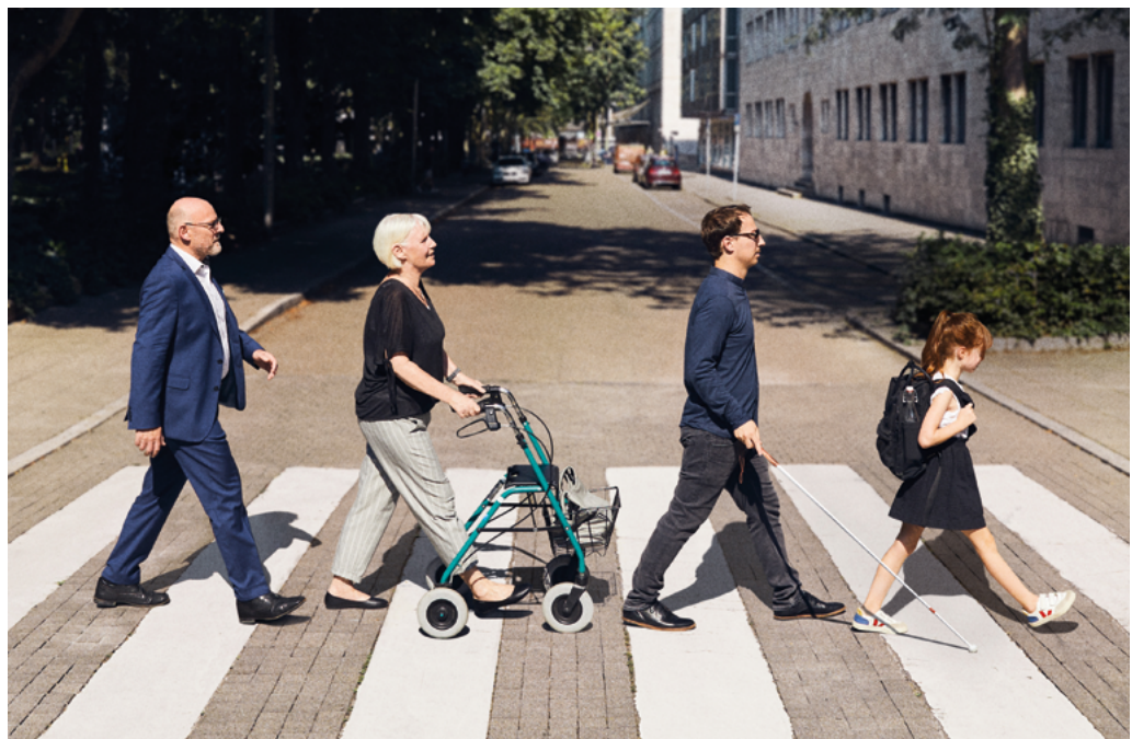
Abbildung 5: Ministerium für Verkehr stellt Album-Cover „Abbey Road“ nach und macht auf das Aktionsprogramm „1.000 Zebrastrifen für Baden- Württemberg“ aufmerksam.

Fehlen sichere Querungsmöglichkeiten, werden vor allem Kinder und ältere Menschen in ihrer Mobilität eingeschränkt. Querungsmöglichkeiten sind daher eine Kernanforderung an attraktive Netze. Zur Erleichterung des Querens können bauliche Anlagen (Mittelseln, Mittelstreifen, Einengungen der Fahrbahn, Brücken und Unterführungen) sowie verkehrsrechtliche Maßnahmen (Fußgängerüberwege und Ampeln) umgesetzt werden.