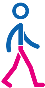
Abbildung 17: Das Signet für Fußverkehr auf der Plattform aktivmobil-bw.de