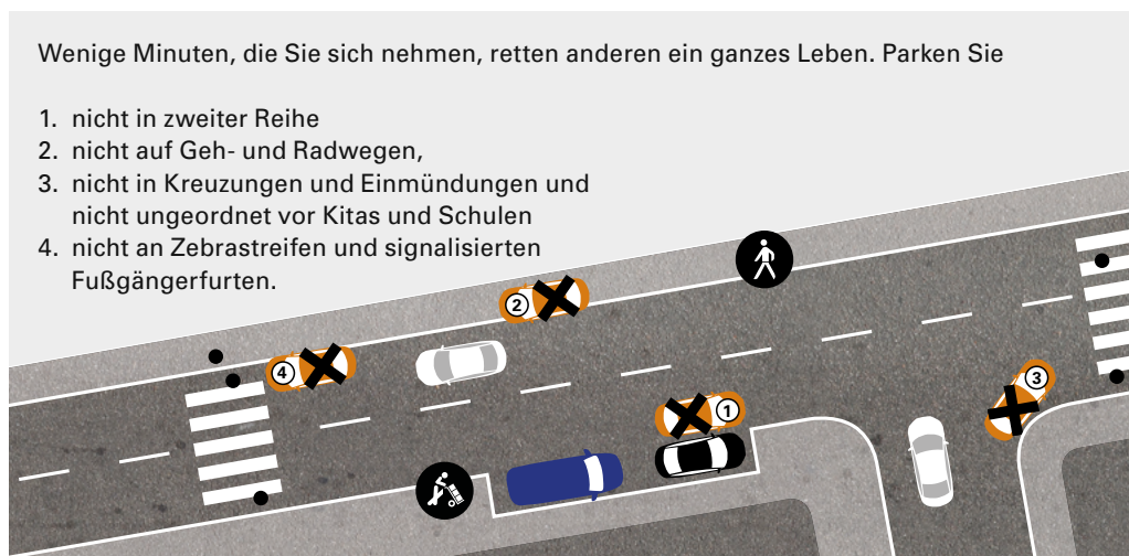
Abbildung 10: Falsch geparkte und haltende Fahrzeuge sind ein oftmals unterschätztes Unfallrisiko

Regelwidriges Parken auf Gehwegen, an Straßenecken und im Bereich von Sichtbeziehungen sollten daher konsequent auf Basis des geltenden Bußgeldkatalogs geahndet werden. Gehwegparken sollte nur zugelassen werden, wenn eine Gehweg-Mindestbreite von 1,5 Metern verbleibt.