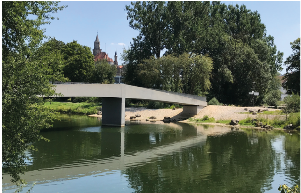
Abbildung 4: Fußgängerbrücke in Sigmaringen