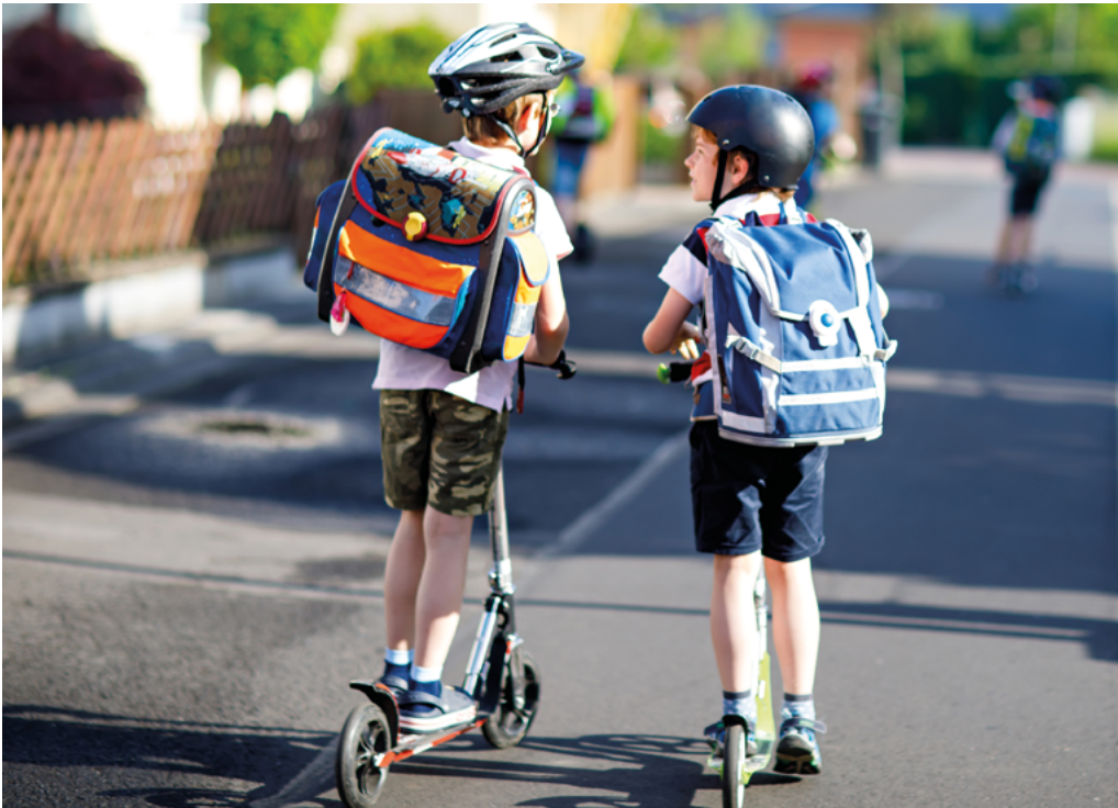
Abbildung 2: Kinderfreundlicher Schulweg