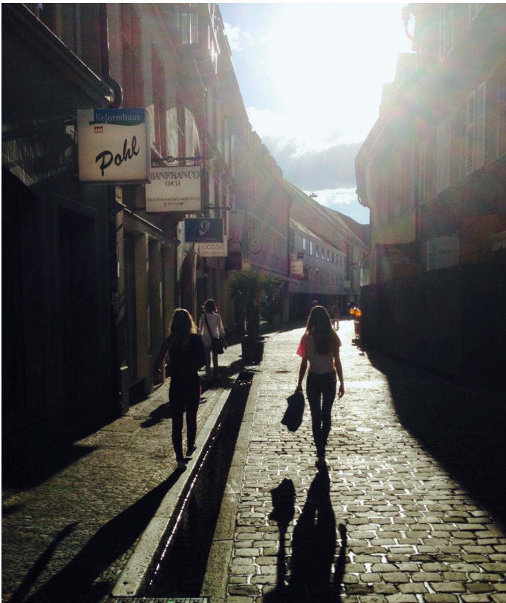
Abbildung 3: Fußgängerzone mit Bächle, Frei- burg im Breisgau