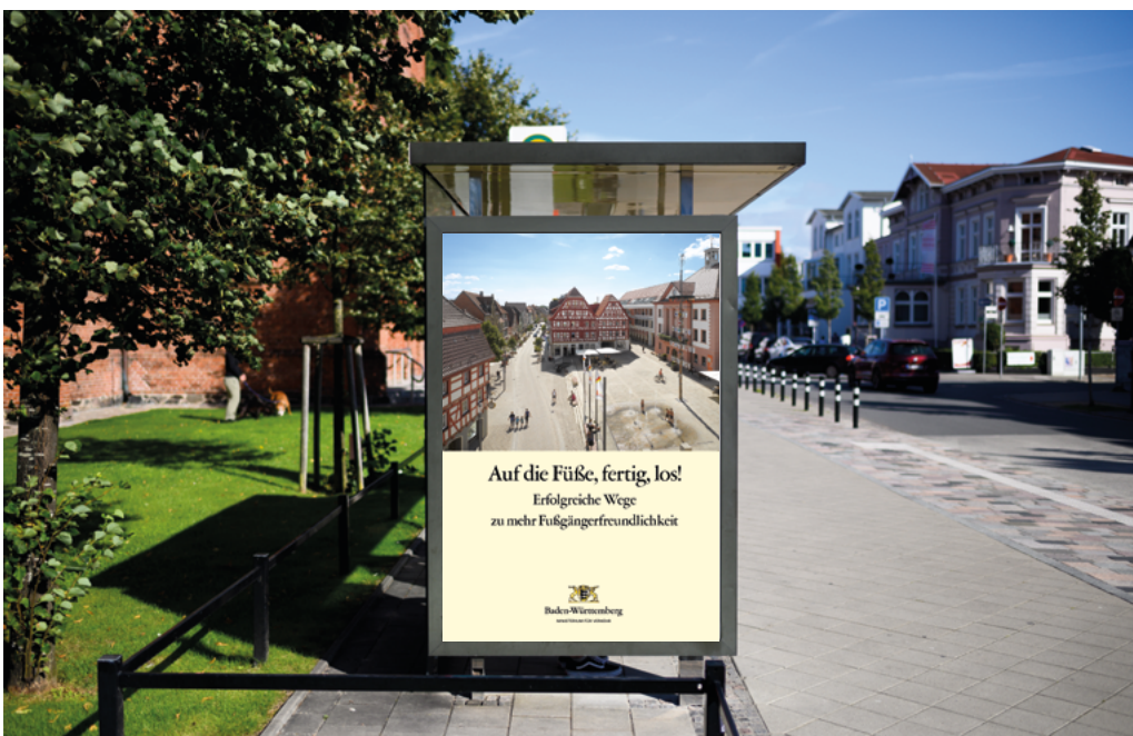
Abbildung 12: Bushaltestelle