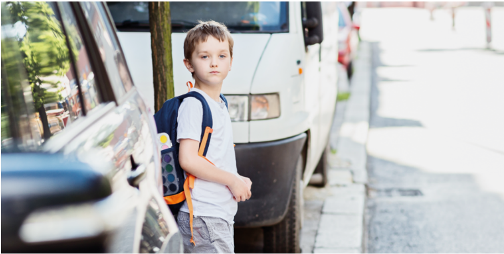
Abbildung 9: Sichtbeziehungen sind eine wichtige Voraussetzung für die Verkehrssicherheit. Parkende Fahrzeuge an Querungen sind ein Risikofaktor – nicht nur für Kinder.