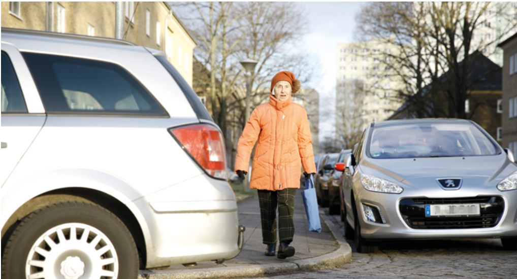
Abbildung 13: Zugeparkte Einmündung gefährdet Fußgängerin; Berlin