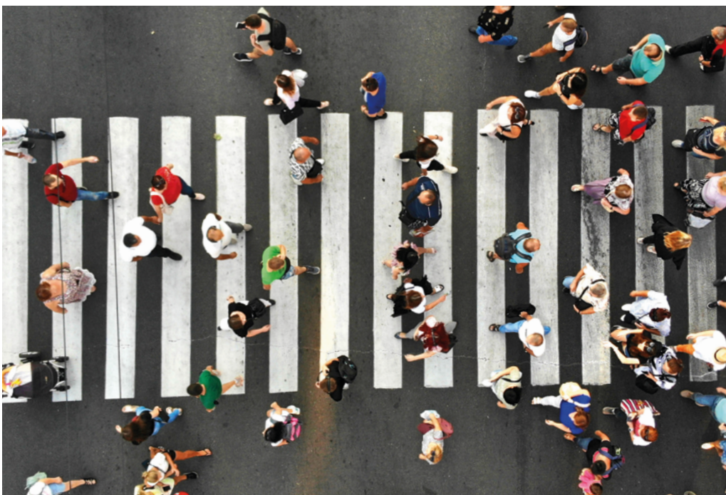
Abbildung 18:

Das Portal www.aktivmobil-bw.de stellt aktuelle Informationen, Förderprogramme, Erlasse, Daten, Zahlen sowie Praxisbeispiele zur Fuß- und Radverkehrsförderung in Baden-Württemberg bereit. Ein Newsletter informiert regelmäßig über aktuelle Nachrichten aus dem Bereich der Aktivmobilität in Baden-Württemberg.