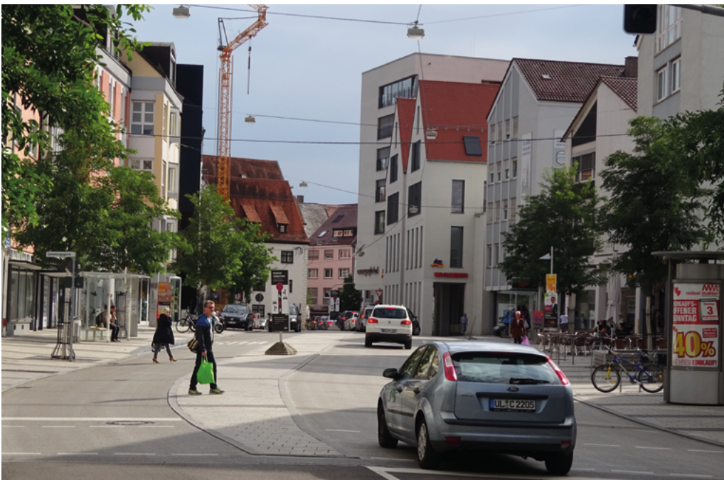
Abbildung 8: Mittelstreifen bietet Sicherheit; Ulm