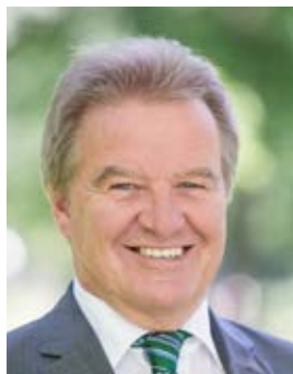
Franz Untersteller MdL

Minister für Umwelt, Klima und Energiewirtschaft Baden-Württemberg