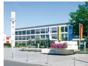
Weil am Rhein ist Teil eines interkommunalen Contracting-Projekts mehrerer Kommunen und Landkreise.