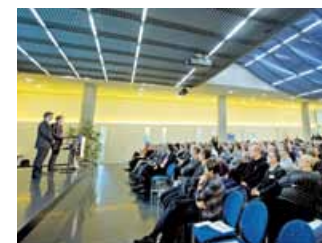
Eingang und Forum der Handwerkskammer Region Stuttgart