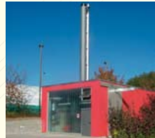
Schulzentrum Karlsbad-Langensteinbach: Die Holzhackschnittzel-Heizzentrale produziert 2.200 MWh pro Jahr. Sie wird mit dem in der Kommune anfallenden Landschaftspflegeholz und unbehandeltem Altholz betrieben.

Tue Gutes und Rede darüber! Gerade in Städten und Gemeinden ist es wichtig, sowohl innerhalb der Verwaltung als auch nach außen zu kommunizieren, dass die Verwaltungsspitze und der Gemeinderat Klimaschutzaktivitäten auch im praktischen Verwaltungshandeln einen hohen Stellenwert beimisst. So kann erreicht werden, dass Entscheidungen der Verwaltung und der Politik regelmäßig auf energetische Auswirkungen hin überprüft werden. Der Energiebeauftragte sollte bei der Erstellung aller energierelevanter Gemeinderatsvorlagen auch formal beteiligt werden. Die Kommune sollte sich öffentlich Ziele setzen, denen konkrete Maßnahmen hinterlegt sind. Sowohl Ziele als auch Ergebnisse sollten aktiv kommuniziert werden. Sowohl die Lokalpolitik als auch ehrenamtlich engagierte Gruppen sollten bei Klimaschutzstrategien beteiligt werden. Dadurch kann die Kommune ihrer Vorbildrolle gerecht werden.