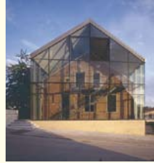
Umbau Alte Schule Neckarwestheim: Das Haus stammt aus dem Jahr 1890 und wurde 2002 erweitert. Der gläserne Erschließungsbau dient als Wärmepuffer für die ungedämmte Nordfassade des Altbaus. Über den großen Luftraum wird die kühle Luft aus dem Untergeschoss in die oberen Geschosse gezogen, um eine natürliche Klimatisierung zu erzeugen.

Gehen Sie mit gutem Beispiel voran und beantworten Sie sich die Frage: „Ist mein Rathaus vorbildlich?“