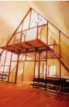
Umbau und Sanierung des Rathauses Hornberg: Im alten Rathaus gibt es jetzt eine neue zentrale Heizungsanlage mit Brennwerttechnik.

Nach der Einführung des kommunalen Energiemanagements gibt es für Kommunen weitere Handlungsfelder, die erheblichen Einfluss auf den Energieverbrauch in der Kommune haben können.