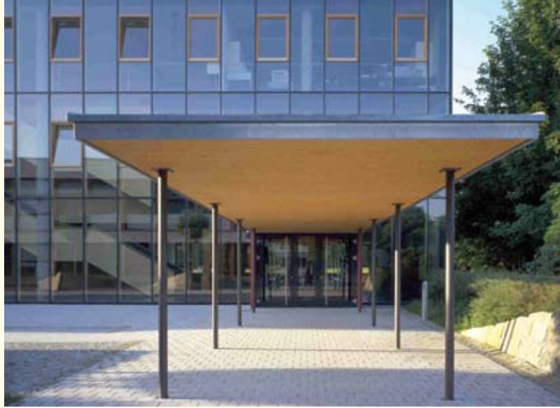
Erweiterungsbau der Gottlieb-Daimler-Schule II Sindelfingen.