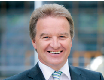
Franz Untersteller Mdl.

»Ich gratuliere der Landesenergieagentur KEA sehr herzlich zur Gründung der fünf neuen Kompetenzzentren. Jetzt können die im Klimaschutzgesetz und im Integrierten Energie- und Klimaschutzkonzept formulierten Ziele noch schneller in die Tat umgesetzt werden als bisher. Die Idee, die vielen Akteure und Experten in Baden-Württemberg aktiv einzubinden, trifft den Puls der Zeit. Denn mit vernetztem Wissen und Know-how lassen sich die wirtschaftlich und ökologisch sinnvollen Klimaschutzmaßnahmen viel schneller mobilisieren.«