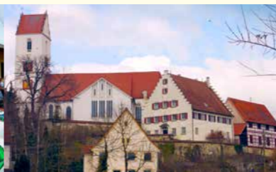
Einbau einer Holzpelletheizung für kirchliche Gebäude in Bingen