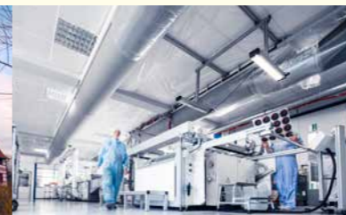
Sanierung der Lüftungsanlage beim Autozulieferer NAP in Pforzheim