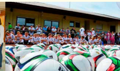
Sanierung des Vereinsheims beim SV Germania Bietigheim