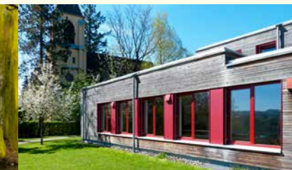
Wärmeschutzmaßnahmen am ev. Gemeindezentrum Bad Waldsee