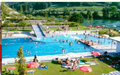
Neue Warmwasserbereitung und Nahwärme im Freibad Laufenburg