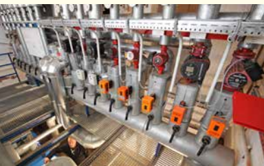
Erneuerung der Heizzentrale in der Grundschule Vöhrenbach