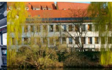
Thermische Solaranlage auf einem Altenpflegeheim in Rottenburg a.N.