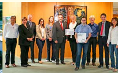
LED-Beleuchtung im Landratsamt des Ostalbkreises in Aalen