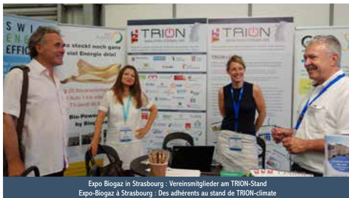
Expo Biogaz in Strasbourg : Vereinsmitglieder am TRION-Stand Expo-Biogaz à Strasbourg : Des adhérents au stand de TRION-climate

Un pas de plus vers un marché international ! De nombreux salons spécialisés dans les bâtiments performants, la production de biogaz, d'énergie éolienne ou de géothermie sont organisés dans le Rhin supérieur. TRION-climate est un partenaire de longue date de ces salons et les soutient dans leur orientation internationale. Les membres de l'association ont un accès privilégié à ces salons et peuvent se présenter en tant que sous-exposant sur le stand de TRION afin de promouvoir leurs produits et services dans un contexte international.