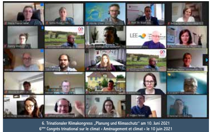
6. Trinationaler Klimakongress „Planung und Klimaschutz“ am 10. Juni 2021 6 ème Congrès trinational sur le climat « Aménagement et climat » le 10 juin 2021

Ensemble, faire du Rhin supérieur une région modèle ! L'échange transfrontalier de savoirs et d'expériences est une mission fondamentale de TRION-climate. L'association propose régulièrement des congrès trinationalaux sur le climat parrainés par la Conférence du Rhin supérieur. À ce rendez-vous annuel s'ajoutent de nombreuses autres conférences organisées en coopération avec des institutions et entreprises partenaires. Les membres de l'association peuvent proposer des thèmes et sont prioritaires pour intervenir et participer à ces rencontres.