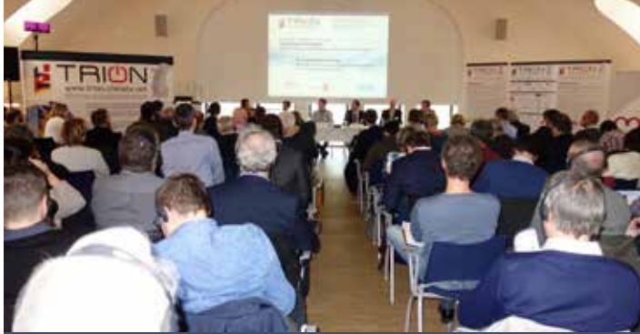
3. Trinationaler Energiekongress „Energiespeicherung“ am 23. November 2017 in Mulhouse 3 ème Congrès trinational sur le thème « Stockage d'énergie » le 23 novembre 2017 à Mulhouse

Grenzüberschreitende Zusammenarbeit beginnt mit Menschen! Das Ziel von TRION-climate e.V. ist es, die Energie- und Klimaakteure aus Politik, Verwaltung und Wirtschaft dies- und jenseits der Grenzen zu vernetzen, um sich kennenzulernen, interkulturelle Hemmnisse abzubauen und vertrauensvolle Beziehungen zu knüpfen. Sie schaffen so eine Grundlage für gemeinsame grenzüberschreitende Projekte.