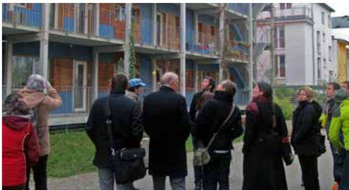
Besichtigung des nachhaltigen Stadtviertels Vauban in Freiburg, Veranstaltungsreihe Green visits Visite du quartier durable de Vauban à Fribourg, événement dans le cadre des « visites vertes »

Die Energiewende hautnah erleben! TRION-climate e.V. organisiert regelmäßig grenzüberschreitende Besichtigungen von vorbildhaften Vorhaben zur Umsetzung der Energiewende. Das sind z.B. nachhaltig gestaltete Stadtviertel, Anlagen zur erneuerbaren Energieproduktion oder besonders energieeffiziente Gebäude und Unternehmen. Diese Besichtigungen finden in kleinen Gruppen statt, und sind vorwiegend den Vereinsmitgliedern vorbehalten.